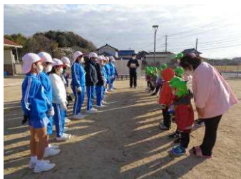
○ 12.20 第二すずらん保育園の園児と一緒に