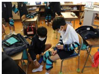
○ 12.22 総社市社会福祉協議会のご協力で実施