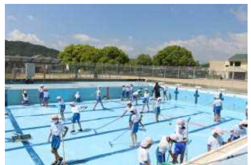
〇5月31日（火） プール掃除の様子

以上の3点の話をしました。子供たちは、プール開きの日を心待ちにしていたことでしょうか。今日も校長室の窓に、プールから聞こえてくる子供たちの黄色い歓声が響いています。本当に再開できてよかったです。